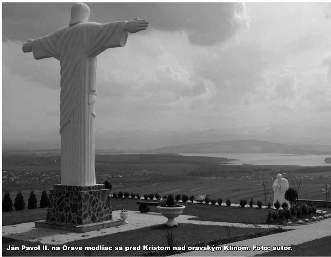
Ján Pavol II. na Orave modlí sa pred Kristom nad oravským Klinom.

Aj tak nazývali počas života a pôsobenia na pápežskom pôsobisku Karla Wojtyły, ktorý pochádzal z Poľska, ale nikdy nemal ďaleko na Slovensko