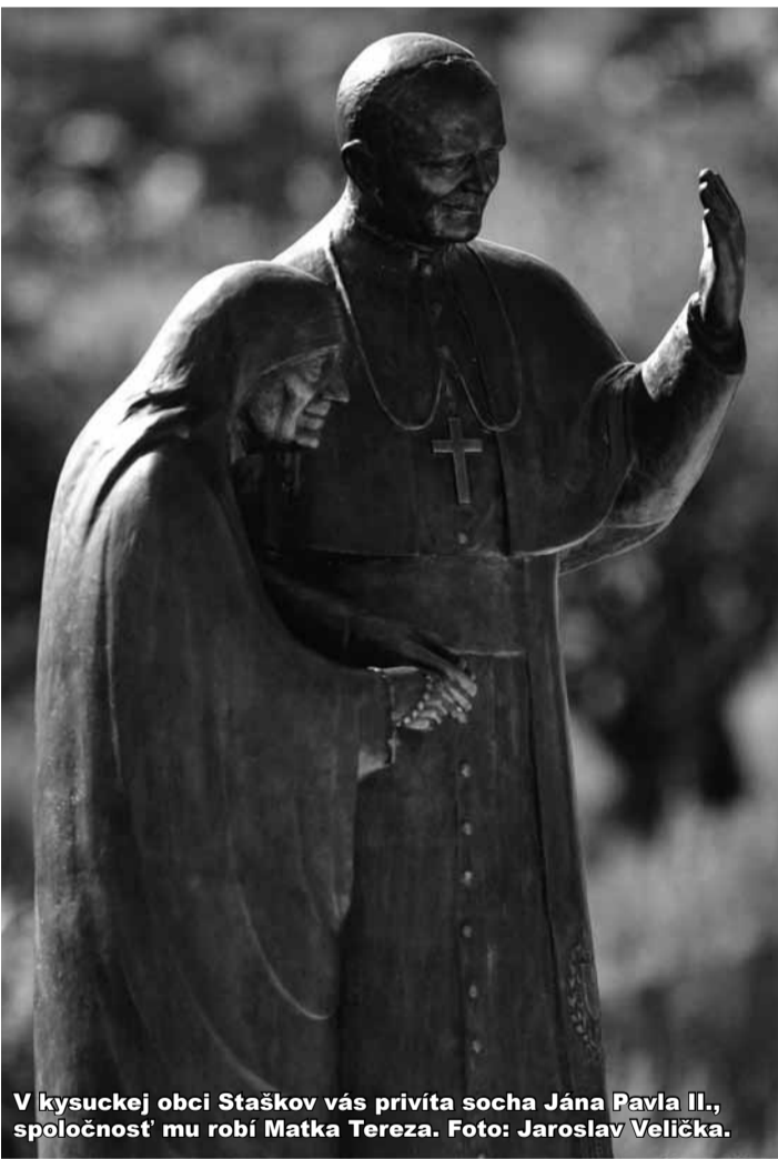
V kysuckej obci Staškov vás privíta socha Jána Pavla II., spoločnosť mu robí Matka Tereza.