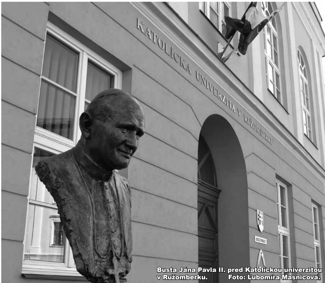
Busta Jána Pavla II. pred Katolíckou univerzitou v Ružomberku.

Po drotárskych stopách našich predkov putujeme z bytčianskej doliny cez Semeteš až do Korne. V tamojšom Kostole Božského Srdca Ježišovho sa ponoríme do modlitby za Jána Pavla II. ako vďaka za jeho po-